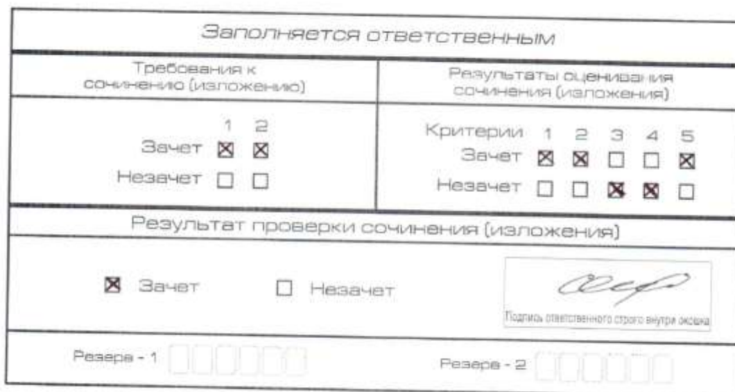
Рис. 6. Область для оценки работы

После окончания заполнения бланка регистрации ответственное лицо ставит свою подпись в специально отведенном для этого поле.